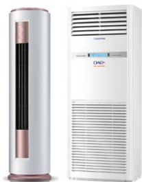
OLE-24 FSDSM / OLE-48 FSDCHM-T

13- Toplu işlerde ve uzun borulamalarda OAC İklimlendirme A.Ş. İndirim talebinde bulunabilir.