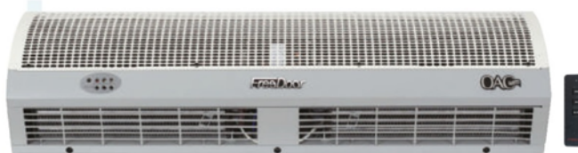
Isıtıcı Hava perdeleri